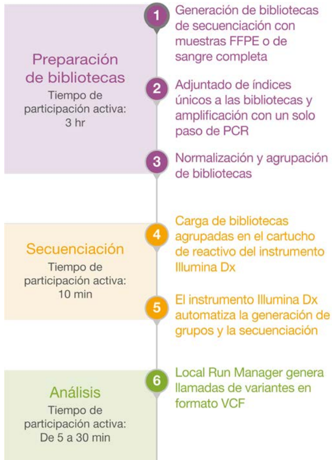
Figura 2: Flujo de trabajo de ensayos optimizado. El flujo de trabajo del kit de amplicones personalizados TruSeq Dx proporciona una solución de ADN a datos con un proceso optimizado de seis pasos.

El kit de amplicones personalizados TruSeq Dx genera bibliotecas listas para la secuenciación que se pueden cargar en un instrumento de secuenciación Illumina Dx para la producción de datos de secuenciación fiables en menos de dos días.