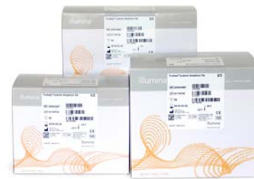
Figura 1: Kit de amplicones personalizados TruSeq Dx: el kit de amplicones personalizados TruSeq Dx, autorizado por la FDA y con certificación CE-IVD, proporciona reactivos de preparación de bibliotecas que permiten que los laboratorios clínicos desarrollen sus propias pruebas diagnósticas diseñadas para su uso con los instrumentos de secuenciación Illumina Dx.

Con el kit de amplicones personalizados TruSeq Dx, los laboratorios clínicos pueden desarrollar ensayos con sondas de oligonucleótidos personalizados. Esta personalización brinda a los usuarios la flexibilidad necesaria para centrarse en regiones específicas de interés.