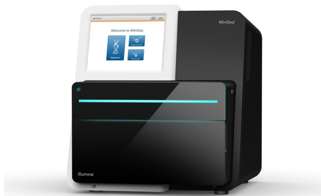
Figura 1: MiniSeq System: mediante o aproveitamento de avanços no processo químico de SBS e com fluxos de trabalho simples e práticos, o MiniSeq System oferece uma solução de biblioteca para resultados poderosa e fácil de usar.

O MiniSeq System fornece uma operação de interface de usuário intuitiva e direta, o que o torna fácil de aprender e de usar. Esse sistema integra amplificação clonal, sequenciamento e análise de dados em um único instrumento, eliminando a necessidade de comprar e operar equipamentos especializados e auxiliares. Depois da preparação da biblioteca utilizando um kit