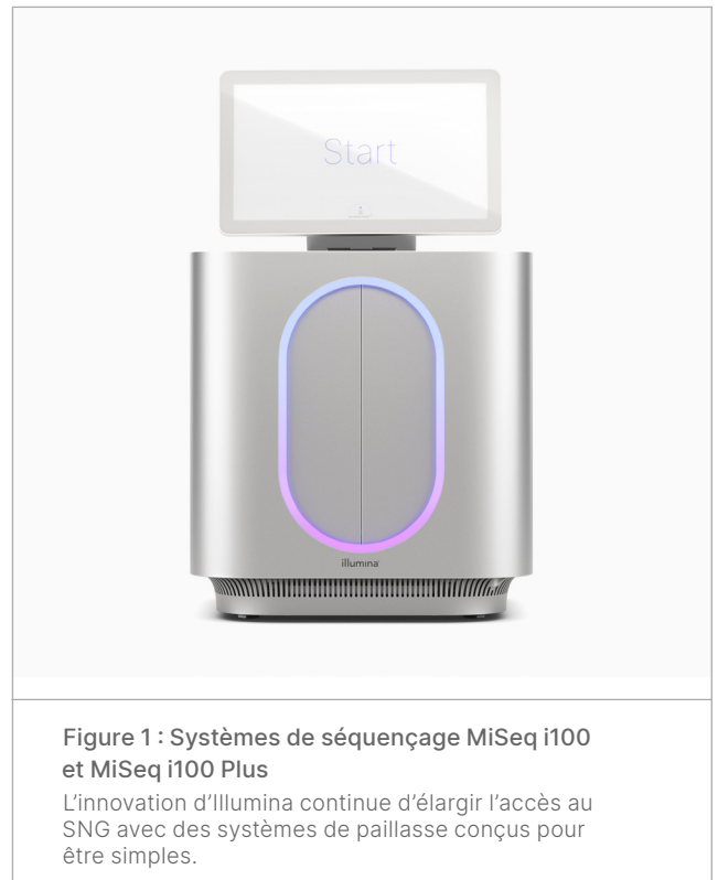
Figure 1 : Systèmes de séquençage MiSeq i100 et MiSeq i100 Plus

Chez Illumina, l'expérience client est au centre de toute innovation, ce qui facilite la préparation des bibliothèques, le séquençage et l'analyse des données. Chaque aspect du flux de travail de la série MiSeq i100 est optimisé pour réduire la durée et les ressources nécessaires à la réalisation de projets (figure 2). Les systèmes MiSeq i100 et MiSeq i100 Plus offrent un flux de travail simplifié avec une configuration de l'analyse en seulement trois étapes et en moins de 20 minutes.