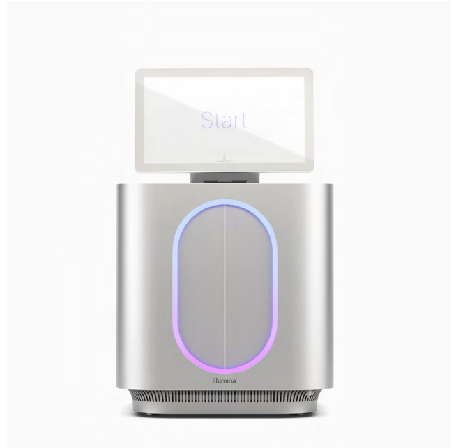
그림 1: MiSeq i100 및 MiSeq i100 Plus 시퀀싱 시스템 — Illumina의 기술 혁신은 계속해서 간편성과 신속함에 중점을 둔 벤치탑 시스템으로 NGS의 접근성을 높이고 있음

Illumina는 고객 경험을 최우선으로 한 혁신적인 기술을 제공함으로써 최대한 간편한 라이브러리 준비, 시퀀싱 및 데이터 분석 프로세스를 지원하고 있습니다. MiSeq i100 시리즈 워크플로우의 모든 구성 요소는 프로젝트의 완수에 요구되는 시간과 리소스를 크게 줄일 수 있도록 최적화되어 있습니다(그림 2). MiSeq i100 및 MiSeq i100 Plus 시스템은 런(run) 설정을 단 3단계에 걸쳐 20분 안에 완료할 수 있는 간소화된 워크플로우를 제공합니다. 로딩만 하면 되는 시약 카트리지와 소모품은 실온 배송 및 보관되므로 시퀀싱 단계 전 시약이 해동되기를 기다릴 필요가 없습니다. 직관적인 인포매틱스(informatics, 정보학)로 터치포인트를 간소화하고 바이오인포매틱스(bioinformatics, 생명정보학) 전문가의 필요성을 최소화해 간편한 분석을 지원하는 초보자와 전문가 모두에게 유용한 시스템입니다.