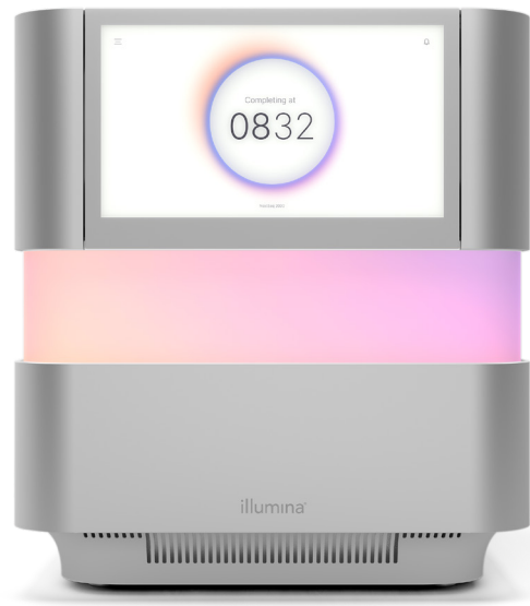
图 1: NextSeq 2000 测序系统 — NextSeq 2000 系统提供创新的设计功能、先进的化学反应、简化的生物信息学和直观的工作流程, 可在台式测序系统上实现最广泛的应用和规模灵活性。

结论: Illumina NextSeq 1000 和 NextSeq 2000 测序系统是可扩展的平台, 可支持当下和未来的研究。