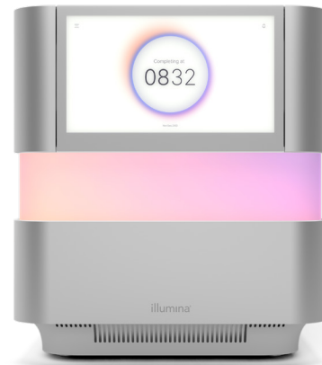
Abbildung 1: Das NextSeq 2000 Sequencing System: Das NextSeq 2000 System zeichnet sich durch innovative Merkmale, fortschrittliche Chemie, vereinfachte Bioinformatik und einen intuitiven Workflow aus, wodurch ein bislang unerreichtes Spektrum an Anwendungen und eine flexible Skalierung auf einem Tischsequenziersystem zur Verfügung stehen.

Das NextSeq 1000 System und das NextSeq 2000 System nutzen XLEAP-SBS-Chemie, eine schnellere, hochwertigere und robustere SBS-Chemie, die auf der bewährten herkömmlichen SBS-Chemie von Illumina aufbaut. Die aktuellen Farbstoffe sowie die neuen Linker und Blöcke der XLEAP-SBS-Nukleotide sind hitzebeständiger sowie 50-mal stabiler in wässriger Lösung und zeigen eine 2,5-mal schnellere Blockspaltung, was Phasierung und Vorphasierung verringert. Die XLEAP-SBS-Polymerase integriert Nukleotide schneller und mit höherer Genauigkeit als je zuvor.