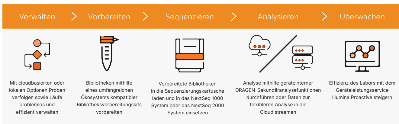
Abbildung 2: Intuitiver Workflow von der Bibliothek zur Analyse: Das NextSeq 1000 System und das NextSeq 2000 System zeichnen sich durch einen umfassenden Workflow mit anwenderfreundlicher Laufkonfiguration, einer breiten Palette an zugehörigen Bibliotheksvorbereitungskits, Load-and-Go-Betrieb und integrierter Sekundäranalyse im Gerät aus.