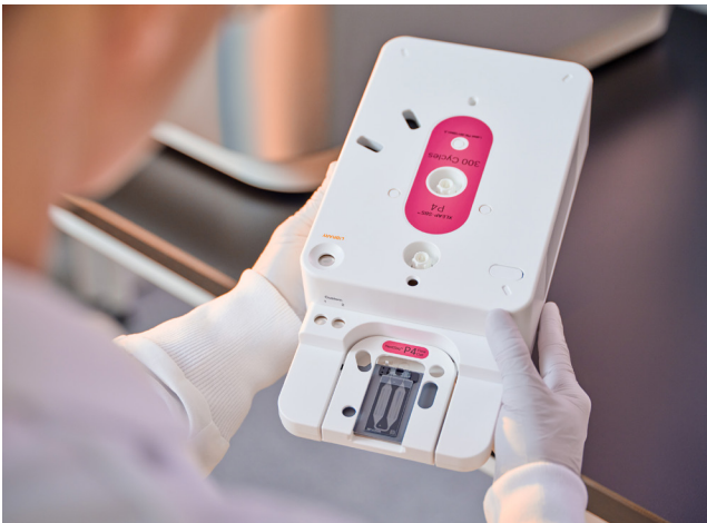
Abbildung 3: NextSeq 1000- und NextSeq 2000-Reagenzienkartusche: Die integrierte Kartusche enthält Reagenzien, Flüssigkeitssysteme und die Abfallaufnahme. Es müssen lediglich die Reagenzienkartusche aufgetaut und vorbereitet, die Fließzelle eingesetzt, die Bibliothek geladen und mit der Kartusche im Gerät platziert werden.

Die Reagenzien verbleiben in der Kartusche. Folglich handelt es sich um ein trockenes Gerät, bei dem kein Waschlaf erforderlich ist. Das verringert den Wartungsaufwand und erhöht die Effizienz des Geräts.