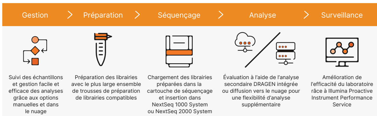
Figure 2 : Flux de travail intuitif de la librairie à l'analyse : les systèmes NextSeq 1000 et NextSeq 2000 fournissent un flux de travail complet qui comprend une configuration conviviale de l'analyse, le plus large ensemble de trousseaux de préparation de librairie compatibles, un fonctionnement de chargement-exécution ainsi que l'analyse secondaire intégrée.