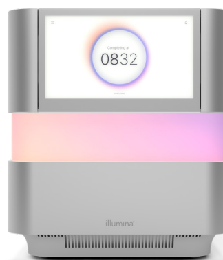
Figure 1 : NextSeq 2000 Sequencing System : le système NextSeq 2000 offre des fonctionnalités de conception innovantes, une chimie avancée, une bioinformatique simplifiée et un flux de travail intuitif opérant la plus large gamme d'applications et offrant une souplesse d'adaptation sur un système de séquençage de paillasse.

Les systèmes NextSeq 1000 et NextSeq 2000 sont alimentés par la chimie XLEAP-SBS, une chimie de séquençage par synthèse (SBS) plus rapide, de qualité supérieure et plus fiable conçue à partir de la base éprouvée de la chimie de SBS standard d'Illumina. Les nucléotides XLEAP-SBS utilisent des marqueurs de pointe et de nouveaux lieux et blocs qui sont plus résistants à la chaleur. Ils montrent également une hydrolyse réduite par un facteur de 50 et un clivage 2,5 fois plus rapide afin de réduire la mise en phase et la mise en préphase.