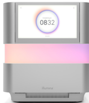
Figura 1: NextSeq 2000 Sequencing System. Il NextSeq 2000 System offre design innovativo, chimica avanzata, bioinformatica semplificata e un flusso di lavoro intuitivo per la più ampia gamma di applicazioni e flessibilità di scala su un sistema di sequenziamento da banco.

Il NextSeq 1000 System e il NextSeq 2000 System si basano sulla chimica XLEAP-SBS, una chimica SBS più veloce, di qualità superiore e più solida basata sulle comprovate fondamenta della chimica SBS standard di Illumina. I nucleotidi della chimica XLEAP-SBS utilizzano coloranti innovativi, nuovi leganti e blocchi più resistenti al calore e mostrano un'idrolisi ridotta di 50 volte e una scissione del blocco più veloce di 2,5 volte per ridurre la determinazione delle fasi e la predeterminazione delle fasi. La polimerasi di XLEAP-SBS è stata progettata per incorporare più velocemente i nucleotidi e offrire una maggiore affidabilità come mai prima d'ora.