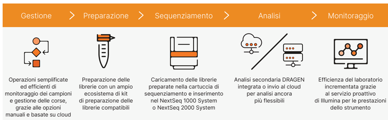
Figura 2: flusso di lavoro intuitivo dalla libreria all'analisi. Il NextSeq 1000 System e il NextSeq 2000 System forniscono un flusso di lavoro completo che include una semplice impostazione della corsa, un ampio ecosistema di kit di preparazione delle librerie compatibili, funzionamento "carica e vai" e analisi secondaria integrata sullo strumento.