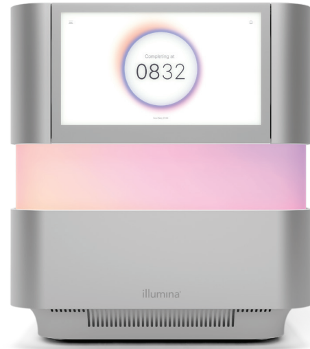
그림 1: NextSeq 2000 시퀀싱 시스템 — 벤치탑 시퀀싱 시스템으로 가장 광범위한 응용과 규모의 유연성을 지원하는 혁신적인 디자인 요소, 진보된 chemistry, 간소화된 바이오인포매틱스 및 직관적인 워크플로우 제공

즉, Illumina의 NextSeq 1000 및 NextSeq 2000 시퀀싱 시스템은 실험 규모의 변경에 따라 적절하게 조정이 가능한 현재와 미래의 연구를 모두 지원하는 플랫폼입니다.