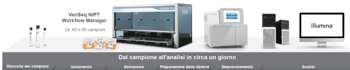
Figura 1: flusso di lavoro NIPT completo per IVD. VeriSeq NIPT Solution v2 fornisce tutto il necessario per il test NIPT utilizzando la tecnologia NGS, inclusi i reagenti per l'estrazione del DNA, la preparazione delle librerie e il sequenziamento, strumentazione per la preparazione delle librerie e il sequenziamento automatizzati mediante Workflow Manager Software, un server onsite per l'archiviazione dei dati e l'analisi sicure e un software per l'analisi dei dati in grado di generare dei report con risultati qualitativi.

VeriSeq NIPT Solution v2 è validato per garantire accuratezza e affidabilità cliniche. Per l'analisi sono stati inclusi campioni appartenenti a gravidanze affette se gli esiti clinici erano disponibili e soddisfacevano i criteri di inclusione del campione. La coorte comprendeva età gestazionale di almeno 10 settimane, campioni con basse frazioni fetali e gravidanze gemellari. Lo studio ha sottoposto a screening oltre 2.300 campioni materni con esiti noti per trisomia 21, trisomia 18, trisomia 13, RAA, CNV di almeno 7 Mb e SCA. I risultati ottenuti con VeriSeq NIPT Solution v2 sono stati confrontati con la verità clinica di riferimento. VeriSeq NIPT Solution v2 ha dimostrato sensibilità e specificità elevate per le trisomie comuni,