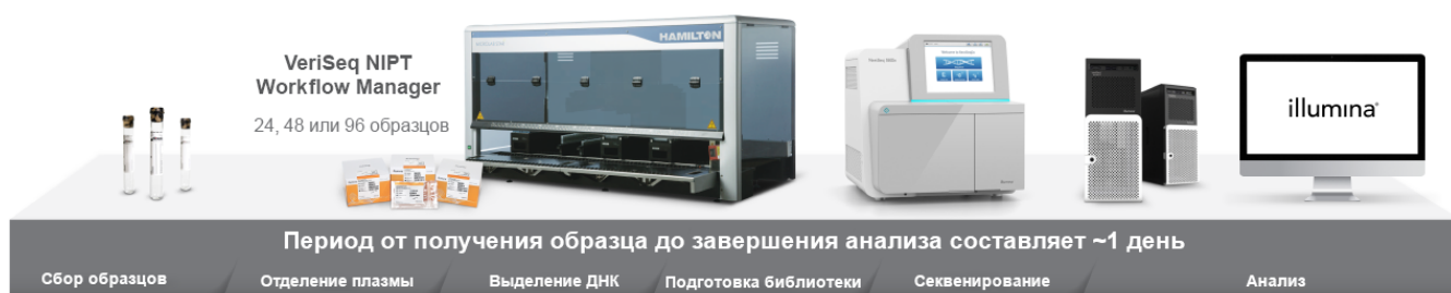
Рисунок 1: Полный рабочий процесс НИПТ для диагностики in vitro : VeriSeq NIPT Solution v2 предусматривает все необходимое для НИПТ с использованием NGS, включая реагенты для выделения ДНК, подготовки библиотек и секвенирования; средства для автоматизации подготовки библиотек и секвенирования с помощью программного диспетчера рабочих процессов; локальный сервер для надежного хранения и анализа данных; а также программное обеспечение анализа данных с возможностью создания отчетов, представляющих качественные результаты.

Для обеспечения клинической достоверности и надежности результатов проведена валидация метода VeriSeq NIPT Solution v2. Для тестирования отбирали соответствующие критериям исследования образцы, полученные у беременных женщин с клинически подтвержденными искомыми аномалиями плода. В эту когорту включали женщин после достижения по меньшей мере 10 недель гестации. Образцы отличались низкой фетальной фракцией или были получены у женщин с двуплодной беременностью. В ходе этого исследования был проведен скрининг более 2300 образцов, полученных у женщин с известными исходами беременности, такими как трисомия по хромосомам 21, 18 и 13, РАА, ВЧК размером \geq 7 Мб, а также АПХ. Результаты, полученные при использовании VeriSeq NIPT Solution v2, сравнили с результатами для соответствующего клинического эталонного стандарта. Высокая чувствительность и специфичность результатов метода VeriSeq NIPT Solution v2 продемонстрированы в отношении распространенных трисомий, РАА, а также ВЧК размером \geq 7 Мб. Показана высокая степень совпадения пола плода, определенного во время тестирования и наблюдаемого клинически, а также низкая частота ошибок при первом тестировании образца — 1,2 % (Таблица 2 и Таблица 3) 1 .